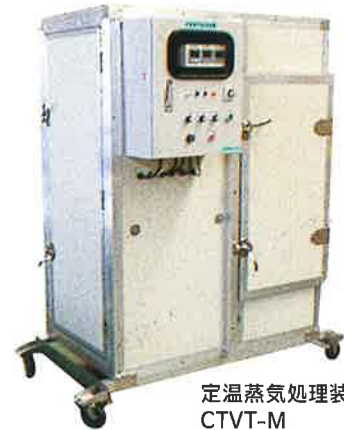
定温蒸気処理装置 CTVT-M

果実のみずみずしさはそのままに蒸気力で丸ごと殺菌 マンゴー……流通時の炭疽黒色斑点の発生を低減 イチゴ……苗時の炭疽病発生を抑制