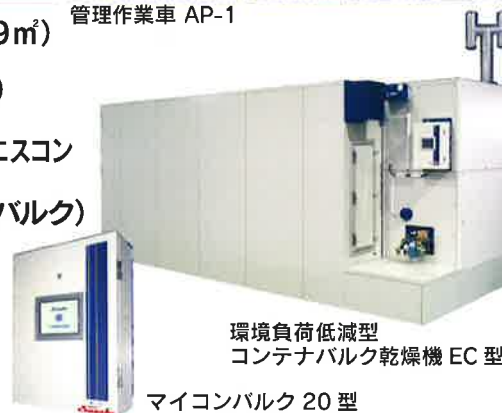
環境負荷低減型 コンテナバルク乾燥機 EC 型