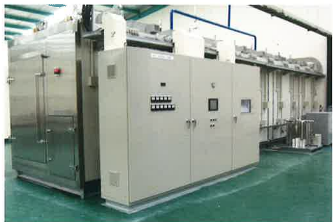
青果物蒸熱処理装置 EHK-500MPC