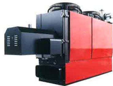
木質ペレット焚 暖房機 SK-400-DF