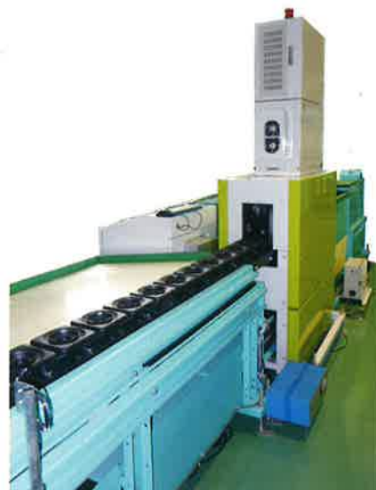
青果物選果機 (糖度計)

非接触近赤外線を用いた糖度、内部品位センサー 重量センサー等を用いた選果選別装置