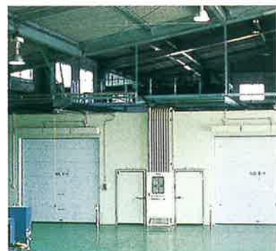
野菜・花卉冷蔵庫

農産物の最適温度、湿度を維持して貯蔵 現在、甘しょ、お茶、しいたけ等の貯蔵に利用