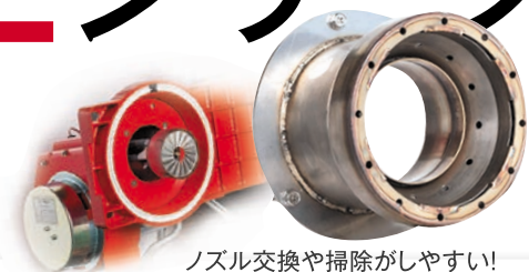
ノズル交換や掃除がしやすい!

高効率の分割火炎燃焼はそのままに、バーナトップの脱着でお手入れが簡単になりました。